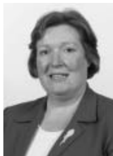
Orlaigh Quinn Príomhoifigeach