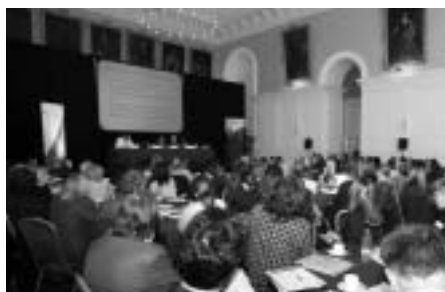
An Fóram um Chuimsiú Sóisialta