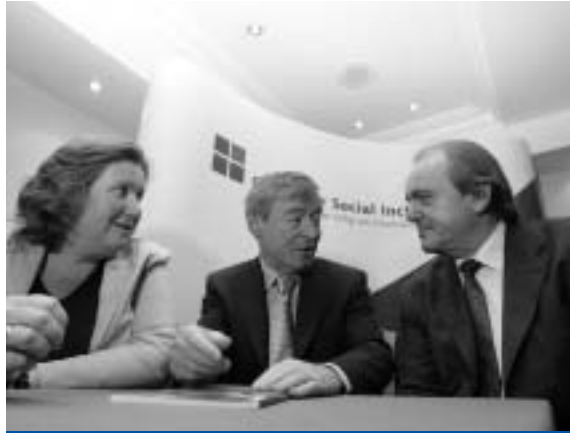
Seimineár comhairliúcháin don Phlean Gnímh Náisiúnta

Cuireadh tús i Meán Fómhair 2005 leis an bpróiseas comhairliúcháin do chéad Phlean Gnímh Náisiúnta eile na hÉireann in Aghaidh na Bochtaine agus an Eisiaimh Shóisialta (NAP/cuimsiú) 2006-2008, le fógraí sna nuachtáin agus sna meáin náisiúnta ag iarraidh ar eagraíochtaí agus ar bhaill den phobal aighneachtaí scríofa a chur isteach, maidir leis na cuspóirí agus na bearta polasaí ginearálta a luafaí sa Phlean. Chuir an OSI treoirínnte, maidir le hullmhú aighneachtaí, ar fáil. Úsáideadh suíomh idirlín OSI – www.socialinclusion.ie – chun cuireadh a chur amach, ag iarraidh aighneachtaí.