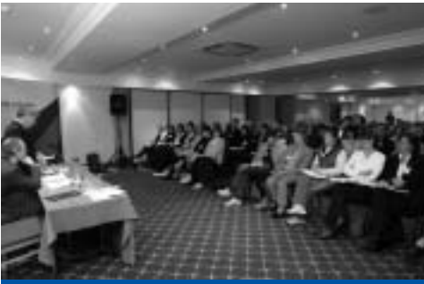
Seimineár comhairliúcháin don Phlean Gnímh Náisiúnta

NAP/cuimsiú, mar aon leis na daoine a bhíonn ag obair leo. 512 líon na ndaoine ar fud na tíre a d’fhreastal ar na seimineáir.