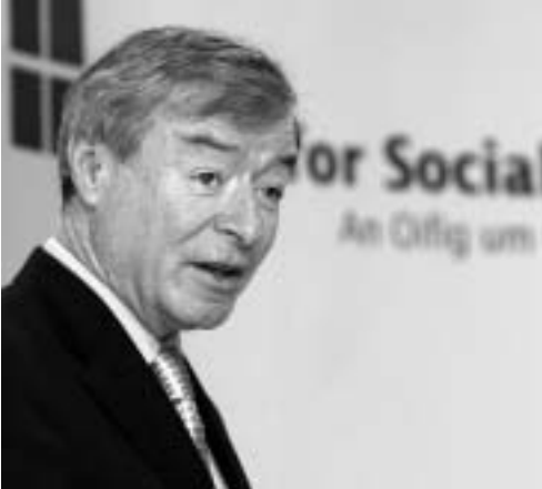
An Aire, Séamus Brennan

Ní gnó don Stát amháin é dul i gcomhrac leis an mbochtaine, ach don tsochaí i gcoitinne. Ar an ábhar sin, aithnítear sa Phlean Gnímh Náisiúnta in aghaidh na Bochtaine agus an Eisiaimh Shóisialta (NAP/cuimsiú) a riachtanaí is atá cumarsáid éifeachtach leanúnach maidir le treochtaí agus le dúshláin a bhaineann leis an mbochtaine agus leis an bpróiseas leanúnach chun dul i ngleic léi, laistigh den Rialtas agus idir an Rialtas agus an lucht leasmhara ar fad.